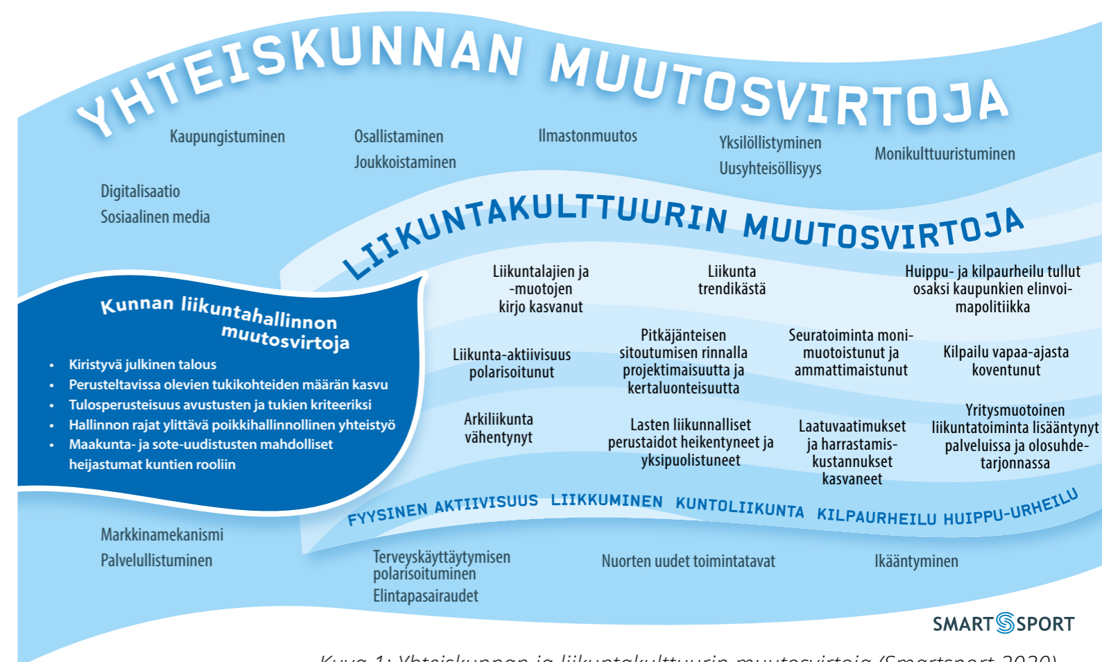
Kuva 1: Yhteiskunnan ja liikuntakulttuurin muutosvirtoja (Smartsport 2020)

Gloaalien ja valtakunnallisten virtojen lisäksi on tärkeää tunnistaa myös paikalliset vahvuudet ja kehittämiskohteet. Kajaanin vahvuuksia liikkumisen kaupunkina ovat neljän vuodenajan tuomat mahdollisuudet, laadukkaat liikuntapaikat ja luonnossa liikkumisen mahdollisuudet. Haasteita Kajaanissa tuottaa vähenevä ja vanheneva väestö sekä liikunnan polarisoituminen (esimerkiksi kilpaurheilun ja terveysliikkujan välille). Kehittämispotentiaali on kuitenkin sekä liikuntapaikoilla että oman toimimisessa liikkumisessa suuri.