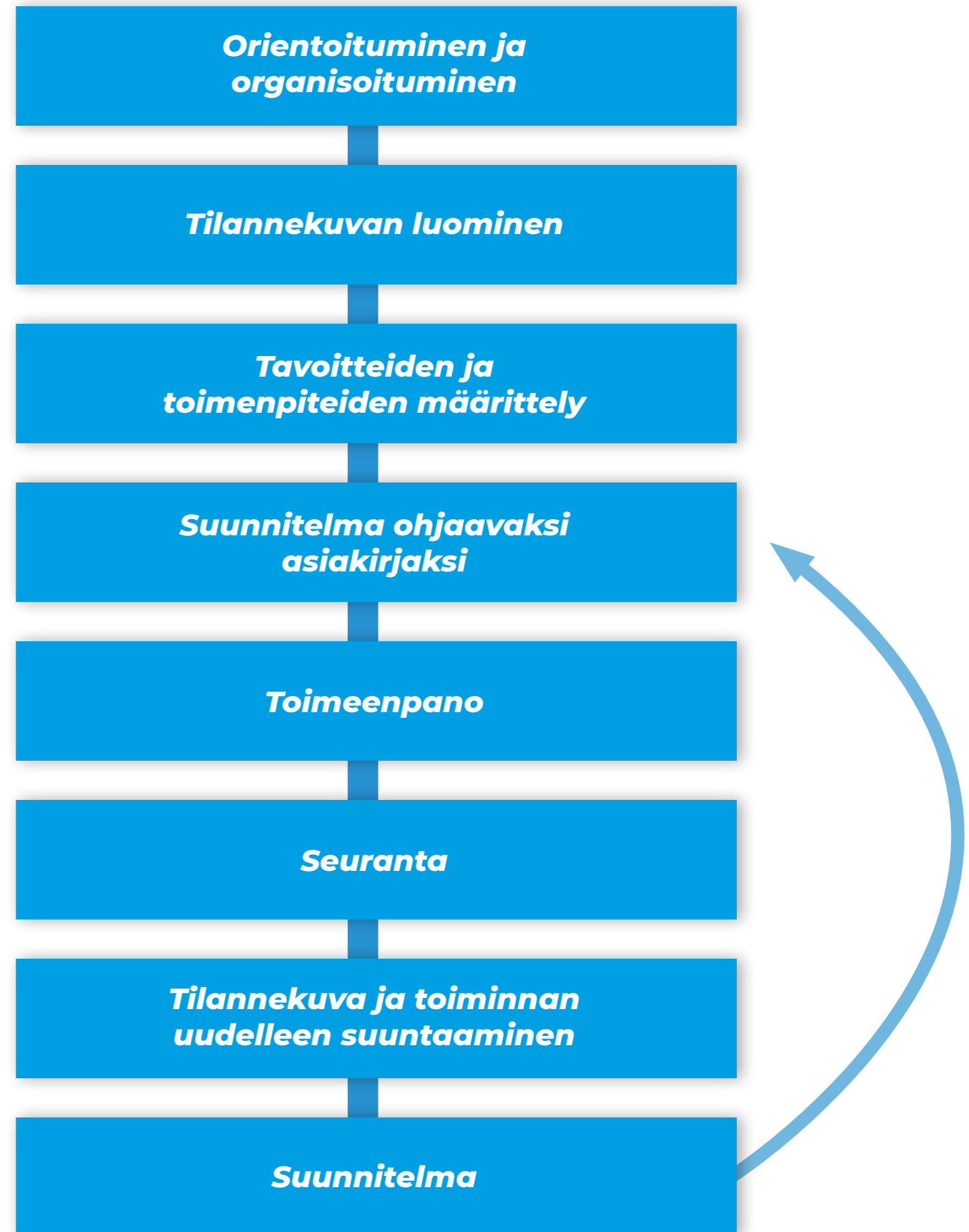
Kuva 2. Liikkumisohjelmatyön eteneminen ja prosessin jatkuminen (mukailtu Smartsport 2020)

Liikkumisohjelma esiteltiin sivistyslautakunnalle ja ympäristötekniiselle lautakunnalle 26.5.2021.